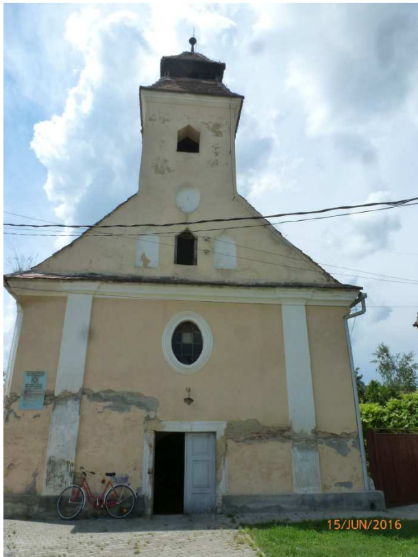
Die evangelische Kirche von Elisabethstadt - 1771 als römisch-katholische Privatkapelle errichtet - muss dringend saniert werden.